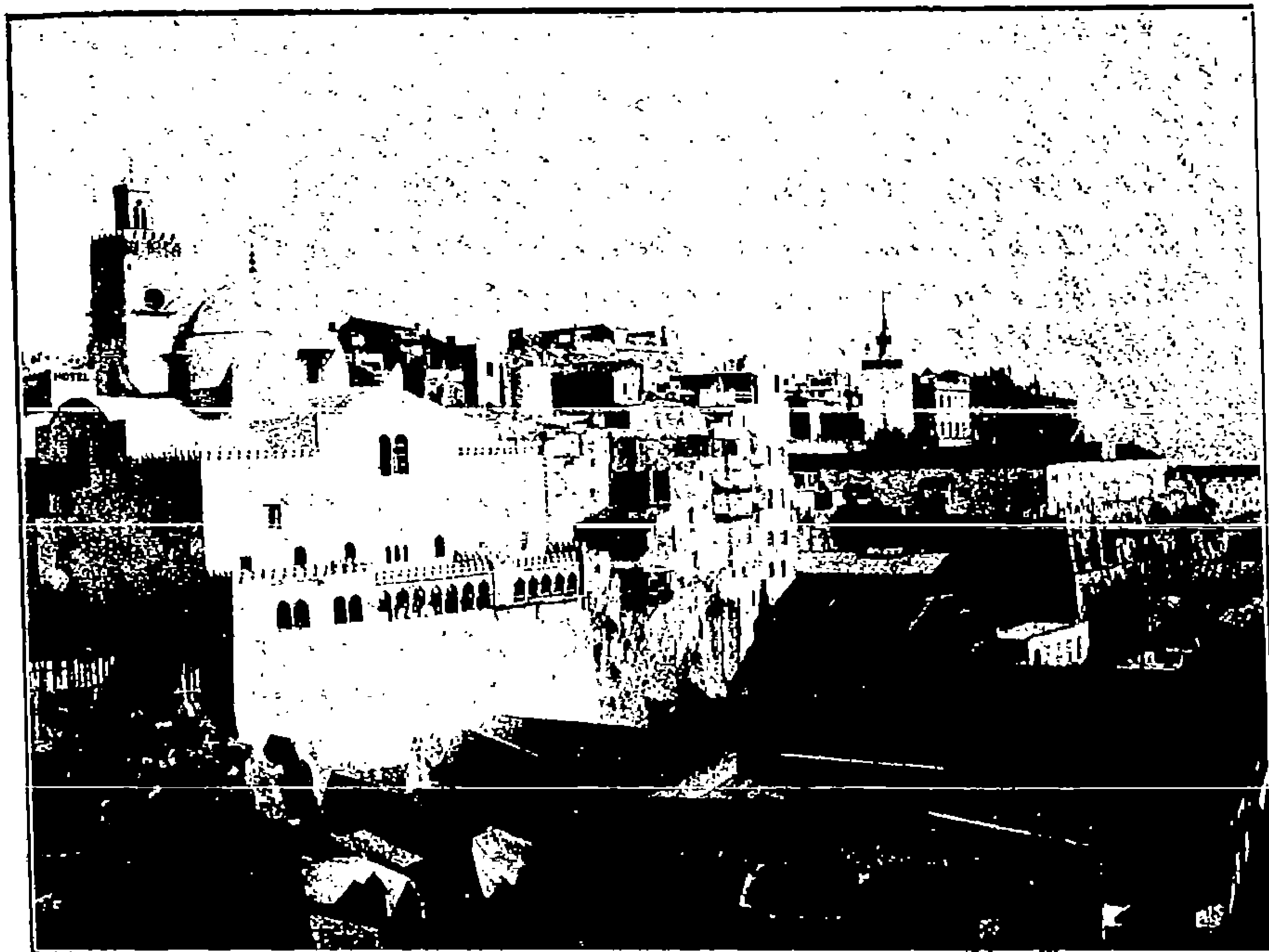
VUE D'ALGER EN 1860